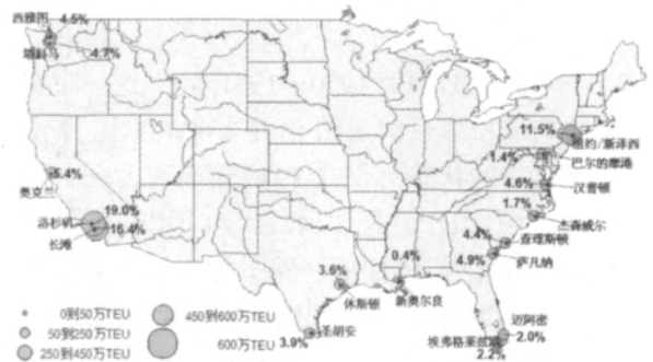
图 6 2009 年美国集装箱港口空间布局 Fig.6 Layout of U.S. container ports in 2009