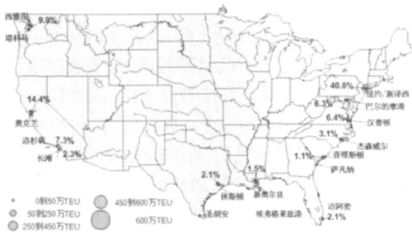
图 3 1970 年美国集装箱港口空间布局 Fig.3 Layout of U.S. container ports in 1970

将搜集到的各年度不同集装箱港口的吞吐量和各年度美国集装箱港口总吞吐量代入公式(1), 得 1970—2009 年美国集装箱港口体系的 HHI, 如图 7 所示。