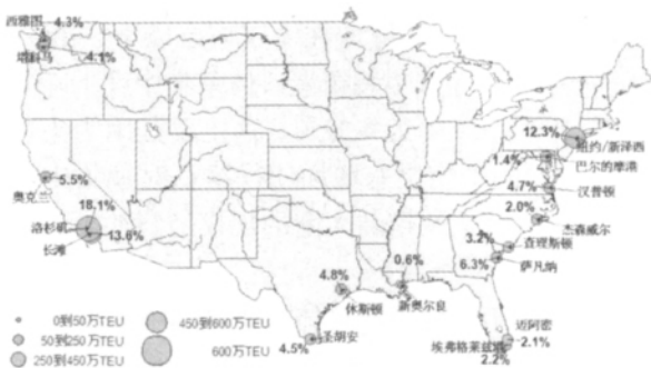
图 5 2006 年美国集装箱港口空间布局 Fig.5 Layout of U.S. container ports in 2006