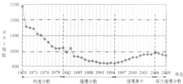
图 7 1970—2009 年美国集装箱港口市场 HHI 指数 Fig.7 Herfindahl-hirschman index of U.S. container ports from 1970 to 2009

以 HHI 值为标准,将 Hayuth 教授提出的美国集装箱港口体系的第四阶段货运中心时代和第五阶段新兴港口挑战的周边崛起时代的时间跨度扩展到 2009 年,发现美国港口集装箱体系的集中度呈现出一定的周期性特征。1970—2009 年美国集装箱港口体系可划分为四个阶段,即 1970—1981 年的快速分散阶段、1981—1995 年的缓慢分散阶段、1995—2006 年的缓慢集中阶段以及 2006—2009 年的再次分散阶段。