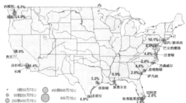
图 4 1995 年美国集装箱港口空间布局 Fig.4 Layout of U.S. container ports in 1995